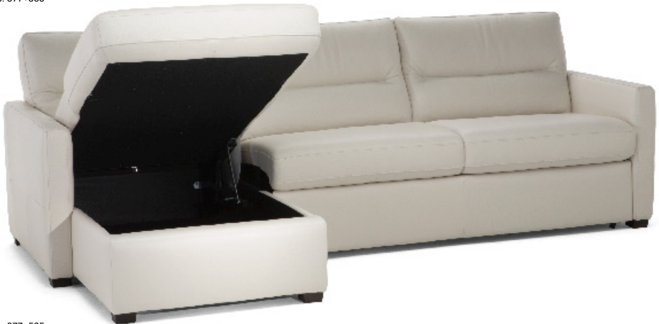
■ Vers. 377+535