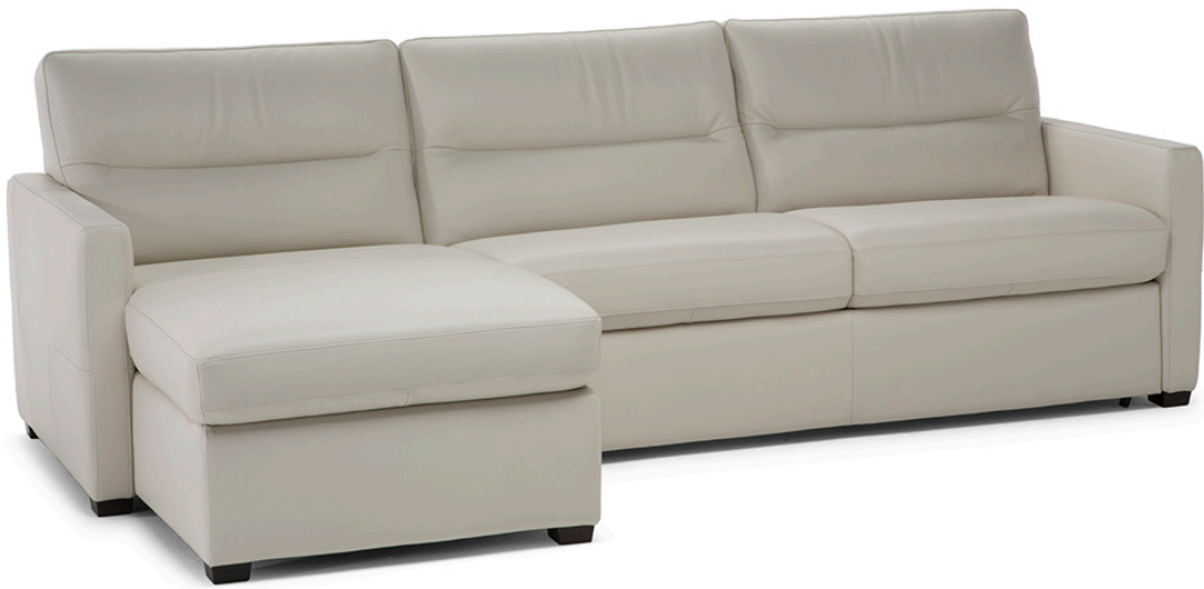
■ Vers. 377+535