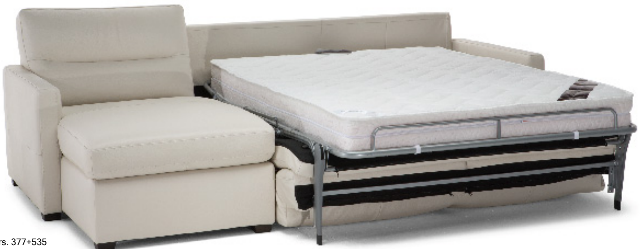
■ Vers. 377+535