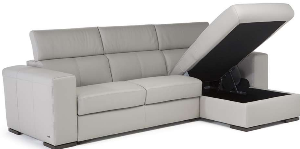
■ Vers. 216+379