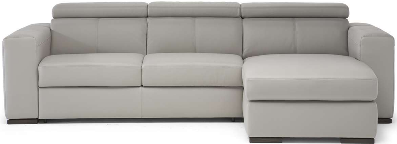
■ Vers. 216+379