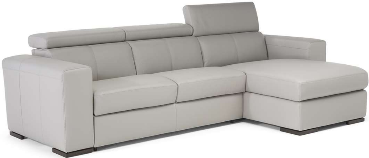
■ Vers. 216+379