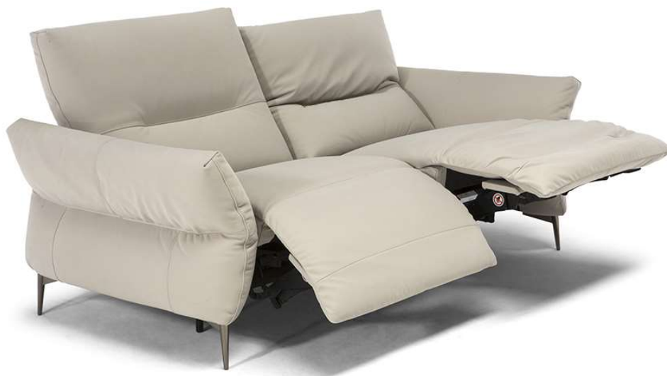
■ Vers. 446