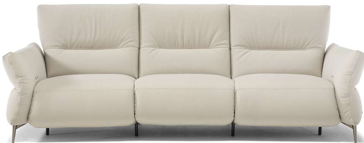
■ Vers. 450+338+452