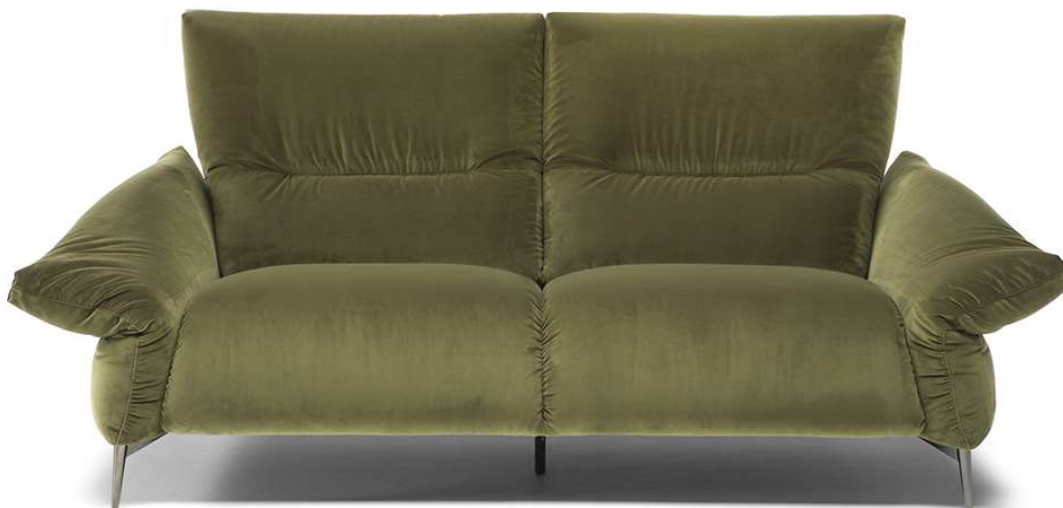
■ Vers. 009